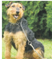
Kilkuletni jack terier znaleziony w Kończycach, tel. 667-735-988