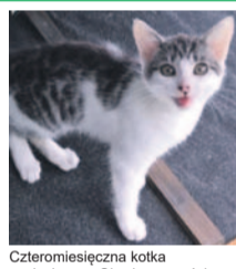
Czteromiesięczna kotka znaleziona w Oławie na moście na Odrze, tel. 509-166-905