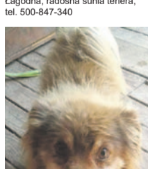
Znaleziono psa na terenie Oławy, tel. 500-847-340