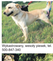
Wykastrowany, wesoły piesek, tel. 500-847-340