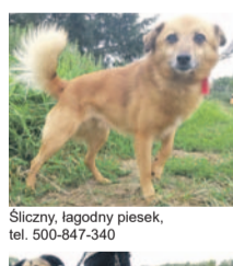
Młody, wykastrowany, łagodny pies, tel. 500-847-340