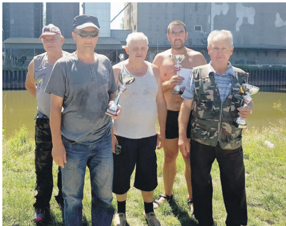
Najlepsi w zawodach Koła Miejskiego PZW nr 16 w Oławie

Zarząd Koła PZW nr 19 w Oławie zaprasza dzieci do lat 14 na zawody o puchar burmistrza Oławy, które odbędą się 26 sierpnia, na stawach w parku miejskim, obok dworca PKP. Ze zgłoszonym dzieckiem musi być opiekun.