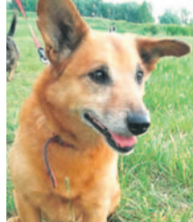
Wesoły, łagodny, wykastrowany piesek, tel. 500-847-340