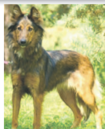
Młoda suczka, mieszaniec owczarka szkockiego, znaleziona w Owczarach, tel. 667-735-988