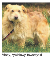
Młody, żywiłowy, towarzyski mieszaniec, tel. 667-735-988