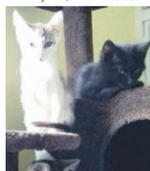
Male kotki, tel. 509-166-905