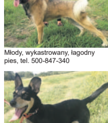
Wesoła, wysterylizowana sunia, tel. 500-847-340