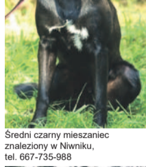
Średni, wykastrowany, pilnujący mieszaniec, tel. 667-735-988