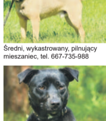
Młoda, wysterylizowana suczka mieszaniec teriera, tel. 667-735-988