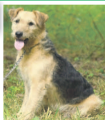
Kilkuletni terier znaleziony w miejscowości Gać, tel. 667-735-988