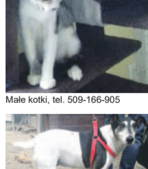
Spokojna, łagodna, wysterylizowana sunia, tel. 500-847-340