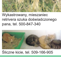
Wykastrowany, mieszaniec retrievera szuka doświadczonego pana, tel. 500-847-340