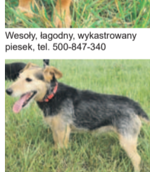
Łagodna, radosna sunia teriera, tel. 500-847-340