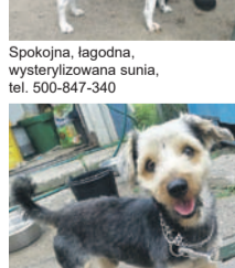
Znaleziono psa na terenie Oławy, właściciela prosimy o kontakt, tel. 500-847-340