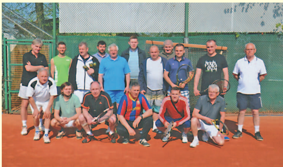
Uczestnicy turnieju deblowego „Marcinkowice Cup 2016”